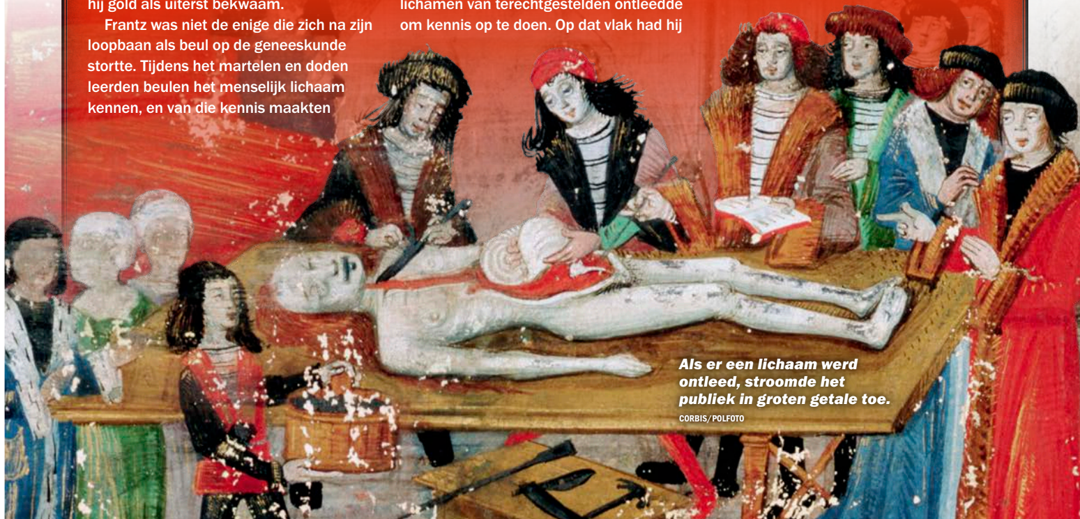
Als er een lichaam werd ontleed, stroomde het publiek in groten getale toe.

Naar eigen zeggen behandelde Frantz 15.000 patiënten in Neurenberg. Dat is waarschijnlijk een tikje overdreven.