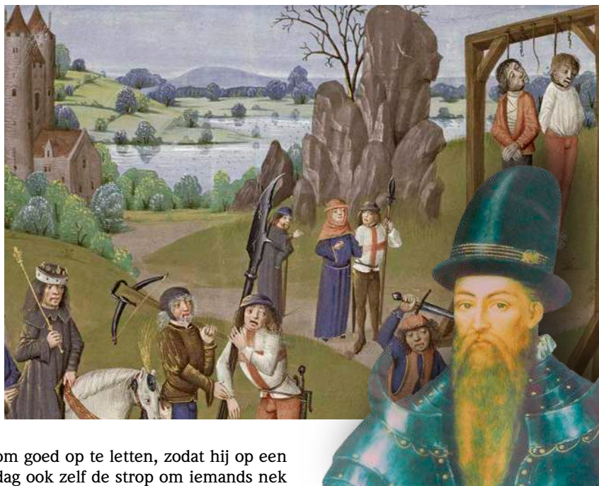
Albrecht II Alcibiades, een gehate markgraaf aan het Duitse hof, wees een willekeurige vogelvangster aan als beul.